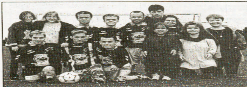
Souvenir d'une rencontre de football France-Angleterre.